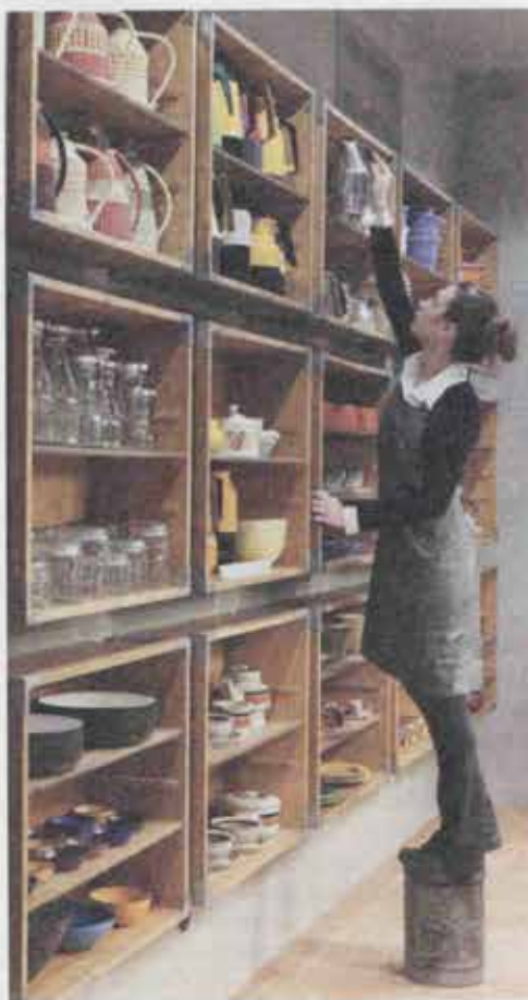
Il negozio Bjork Side Store

VIA PANFILO CASTALDI Bjork Side Store, via Panfilo Castaldi 20, tel. 0249457424, aperto mart. - sab. 10.30/20.